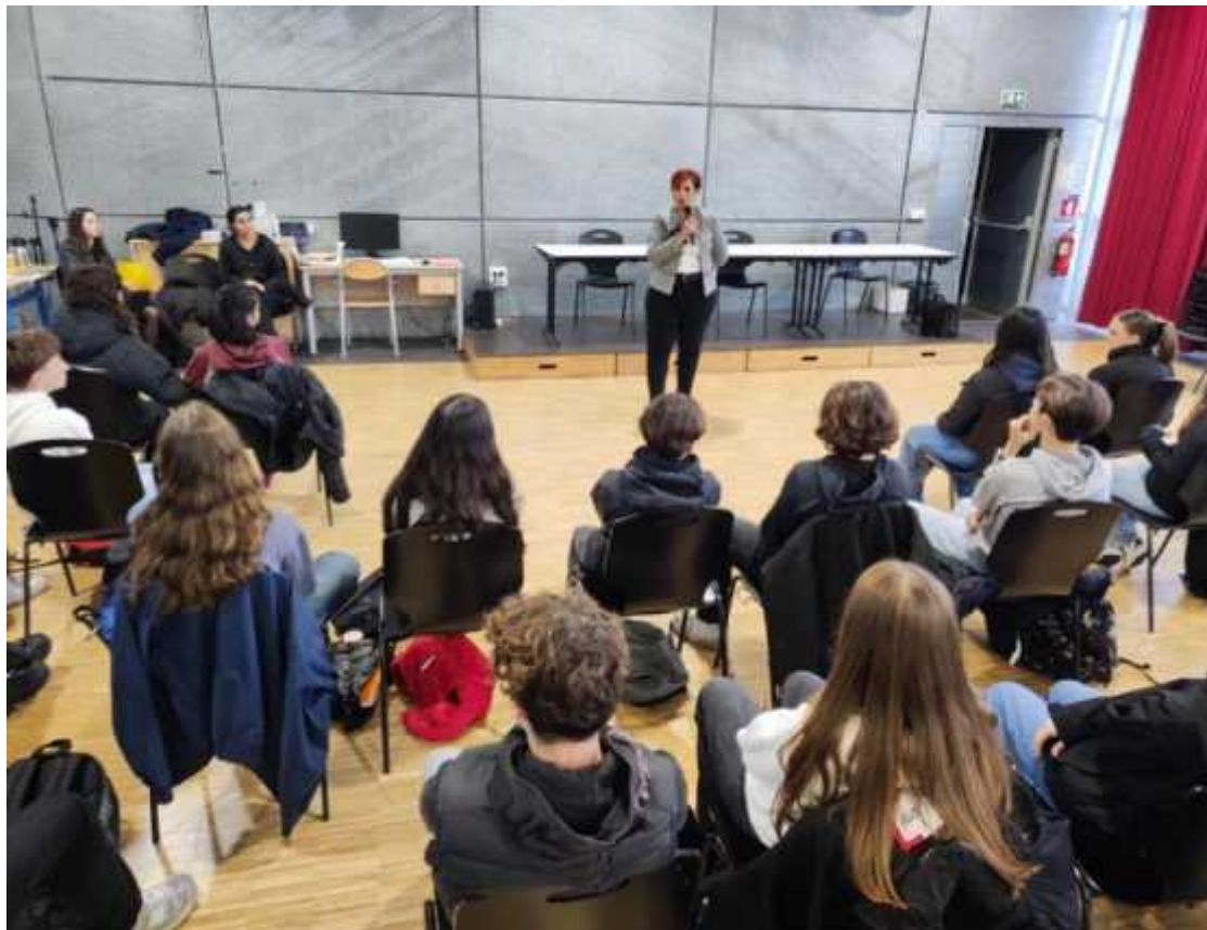
« L'idée, c'est de monter la variété de nos métiers et milieux professionnels », s'accordent à dire plusieurs responsables d'entreprise.