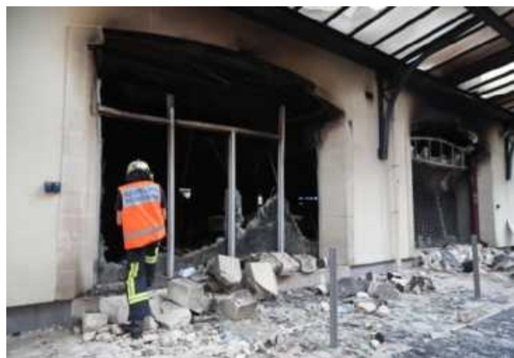
L'incendie du marché couvert s'est produit dans la nuit du vendredi 1 er au samedi 2 septembre.

Le sinistre d'ampleur avait mobilisé de nombreux pompiers. Depuis, les 17 commerçants permanents du marché couvert ont été soit relocalisés dans des boutiques en dur comme le boucher rue Jules-Ferry, soit installés en plein air place Abel-Surchamp ou sur le